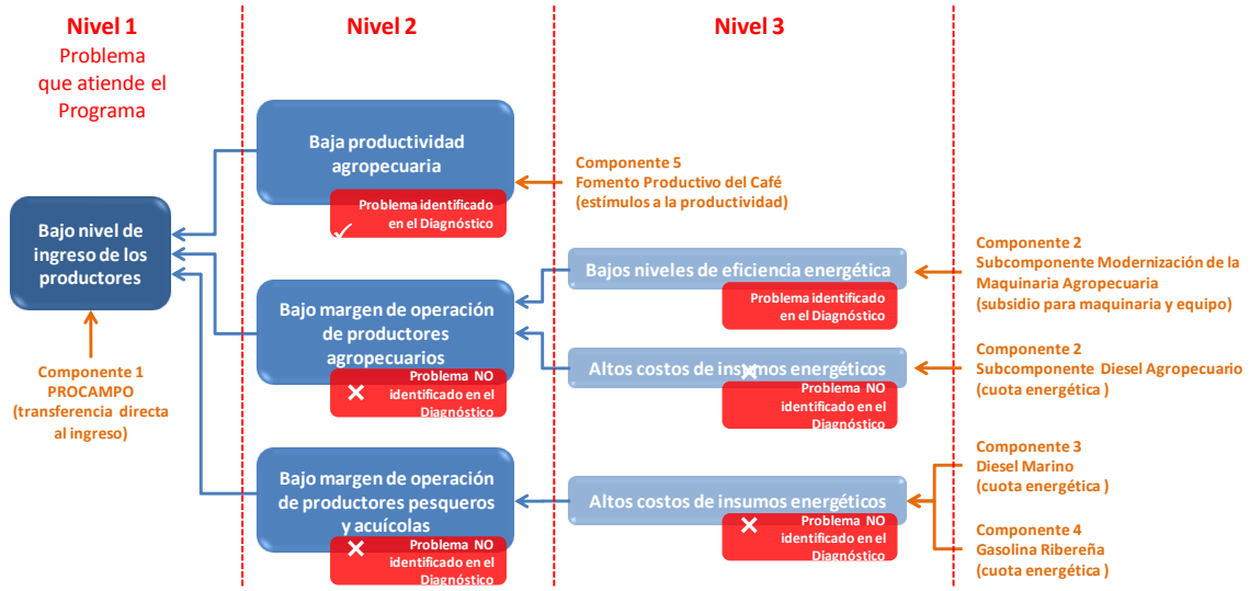
Figura 1 Análisis de la problemática que atiende el Programa y sus Componentes