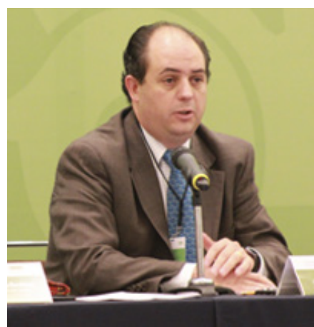
LIC. SALVADOR BEHAR Director General para América del Norte, Secretaría de Economía.

Esta sesión se señaló la importancia de la renegociación de este Tratado y coincidían en defender el TLCAN, en el sentido de no permitir que se modifiquen las condiciones que permiten el acceso libre de productos agropecuarios, de la misma manera, se propuso mejorar las reglas que rigen el Tratado, incrementado la transparencia de aplicación y eliminando las reglas del comercio, así como las medidas de movilización en la frontera.