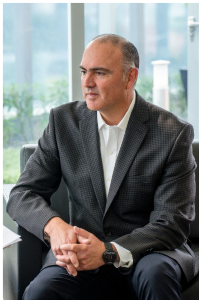
Lic. José Eduardo Calzada Roviroza Secretario de la SAGARPA y Presidente del Consejo Mexicano.

El Consejo Mexicano para el Desarrollo Rural Sustentable no es solamente importante, es una obligación del Gobierno Federal. Escuchar las voces de todos los actores: políticos, sociales y económicos reunidas para tomar las mejores decisiones, con la intención de elevar la calidad de vida de nuestra gente. Por eso, para un servidor, para los Subsecretarios, para los Coordinadores Generales, para el Oficial Mayor y para todos los que integramos esta Secretaría, es de suma importancia escuchar todas las recomendaciones y propuestas que hacen los consejeros para darle orientación y causar el campo mexicano, con el propósito de consolidarnos como una región económica potente, productora, campeona a nivel global que sin duda alguna va a beneficiar de manera sostenida la calidad de vida de nuestra gente.