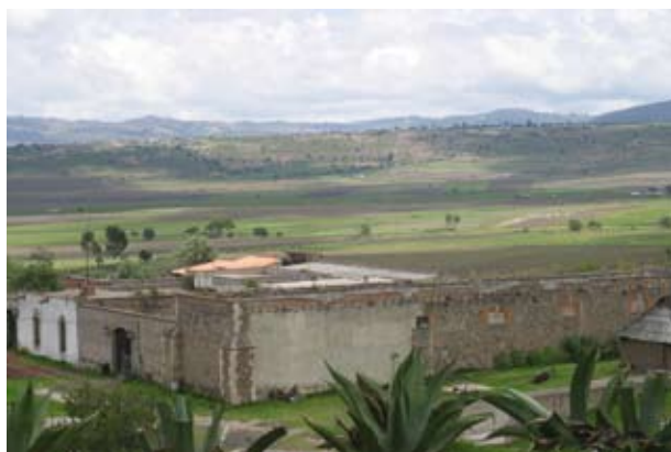
Foto: Instituto Nacional para el Desarrollo de Capacidades del Sector Rural

META 1.4. Reforestar 3 millones de hectáreas (incluye reforestación simple, reforestación con restauración de suelos y apoyo a plantaciones forestales comerciales).